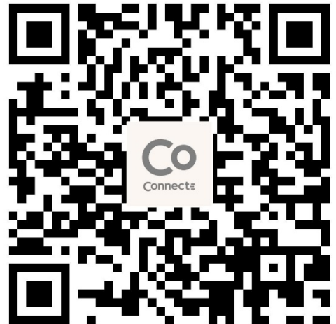
QR kode for Connecte app nedlastning